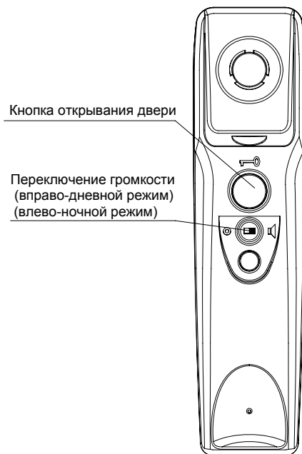
Рис1 Внешний вид с тыльной стороны трубки

Устройство абонентское изготовлено в виде телефонной трубки с подставкой. Органы управления устройства абонентского А5 показаны на рис. 1.